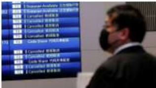
Japón cierra sus fronteras por la variante Ómicron y la OMS señala un "riesgo global muy alto"