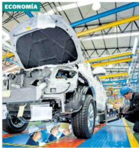
La fábrica de la empresa china Foton, que se ubica en Funza.