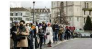
■ Suiza se convierte en el primer país que aprueba en las urnas el "pasaporte Covid"