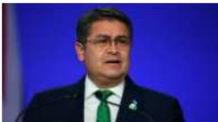
Honduras: ¿cómo queda el país tras la salida de Juan Orlando Hernández?