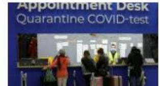
■ Países Bajos y otras naciones detectan contagios de la nueva variante 'Ómicron'