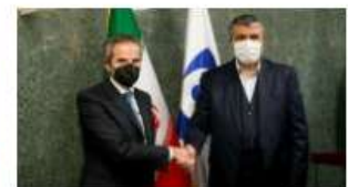
El equipo negociador de Irán se reúne previo a las conversaciones nucleares