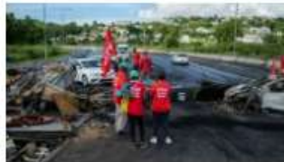
Ministro francés viaja a Guadelupe y Martinica, tras disturbios por plan de vacunación obligatoria