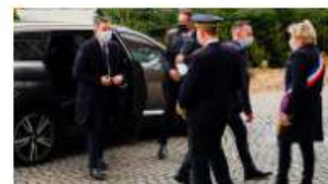
Calais es escenario de reunión sobre el Canal de la Mancha, sin presencia británica