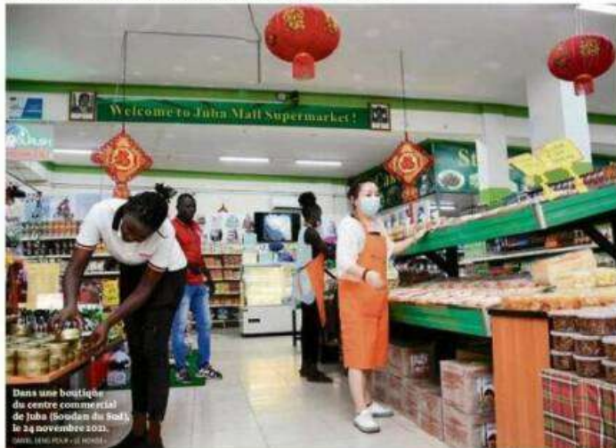
Dans une boutique de centre commercial de Juba (Soudan du Sud), le 24 novembre 2021.