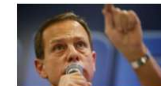
El gobernador de Sao Paulo Joao Doria se convierte en candidato a la Presidencia de Brasil