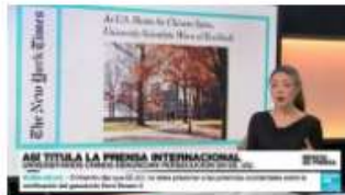
REVISTA DE PRENSA En EE. UU., la persecución de "académicos chinos" en búsqueda de espías, por 'The New York Times'