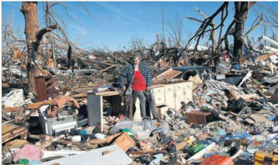
Un hombre examina los restos de su casa, reducida a escombros por el paso de un huracán en Mayfield, Kentucky (EE UU).

GUILLERMO ABRIL. Bruselas La Comisión Europea propondrá esta semana la creación de reservas estratégicas de gas y un esquema voluntario de compra conjunta de este combustible. El objetivo es que los países puedan hacer frente a períodos críticos de desabastecimiento o de precios disparados. Para la compra conjunta se crearán grupos formados por varios países que compartan riesgos o necesidades y cada Estado podrá almacenar las provisiones en su territorio o en un país de su mismo grupo. PÁGINA 50