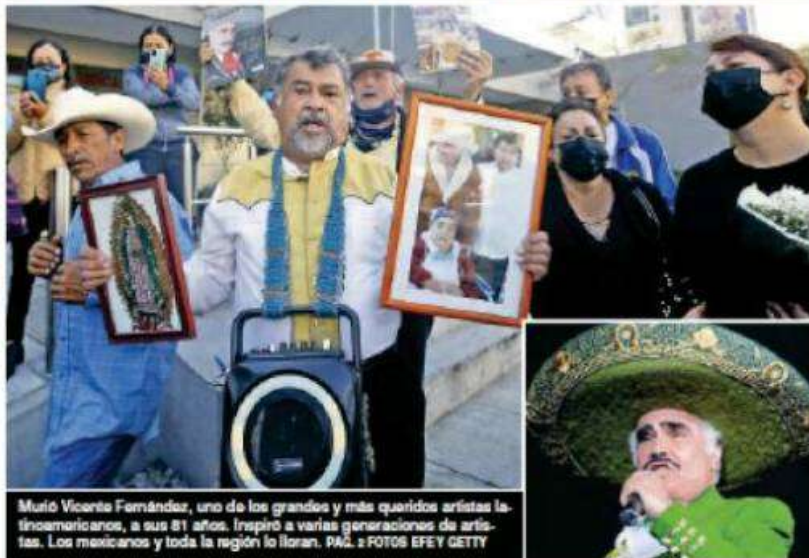
Murió Vicente Fernández, uno de los grandes y más queridos artistas latinoamericanos, a sus 81 años. Inspiró a varias generaciones de artistas. Los mexicanos y toda la región lo lloran. PÁG. 2