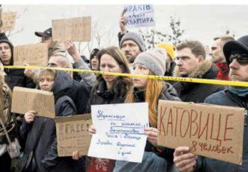
CHARITY Offering refugees arriving at the Polish border free rides to cities in Poland and beyond.