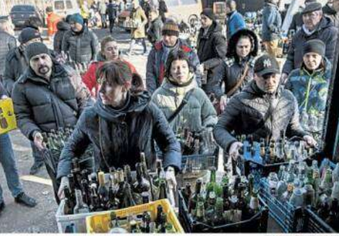
INDUSTRY Gathering empty bottles in the city of Dnipro on Sunday to make Molotov cocktails.

By MARIA VARENKOVA KHOMUTYNTSI, Ukraine — The villagers appeared as silhouettes in the headlights of cars and trucks, a few carrying guns and others clubs, as if they were gangsters roaming the streets.