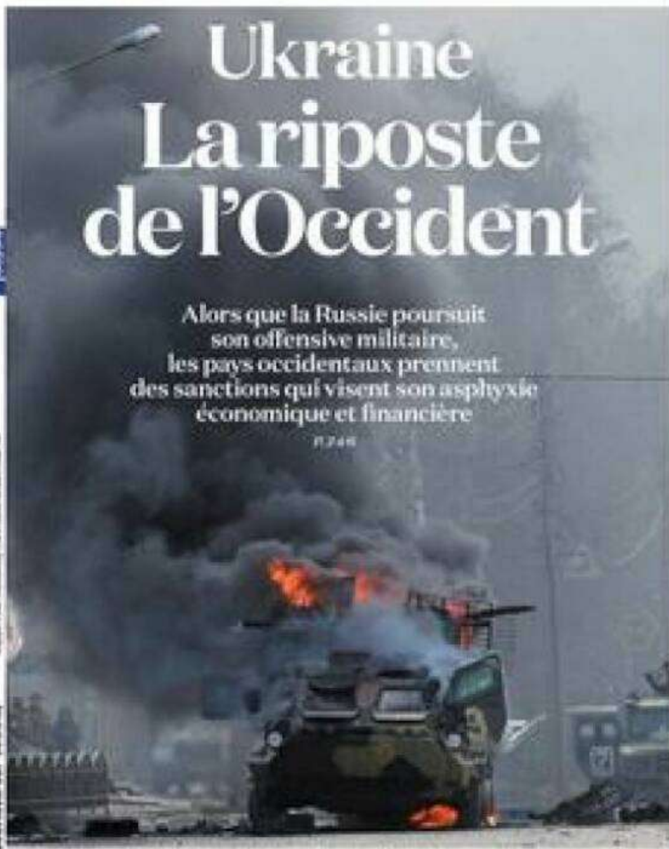
La colonne blindée russe en feu à Donetsk, dimanche 27 février lors d'un combat avec les forces ukrainiennes.

100 ans 1917 100 ans 1917 100 ans 1917 100 ans 1917 100 ans 1917 100 ans 1917 100 ans 1917 100 ans 1917 100 ans 1917 100 ans 1917