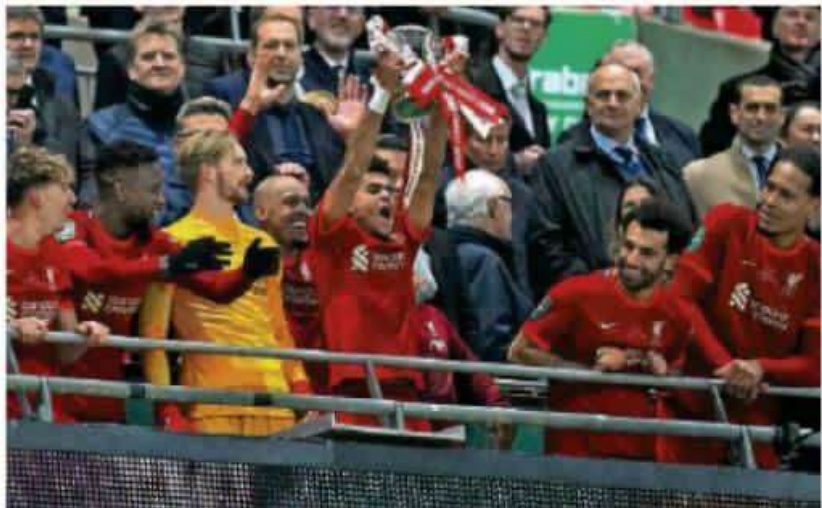
El guajiro, quien completó 24 días en el Liverpool, ya suma su primer trofeo con los rojos de Inglaterra. Tras el triunfo de su equipo por penales ante el Chelsea, Luis Díaz conquistó su séptimo título como profesional. PÁG. 10