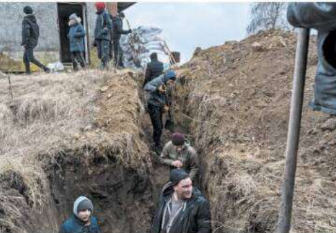
TENACITY Local men digging a bunker and erecting a checkpoint in the village of Hushchynati.