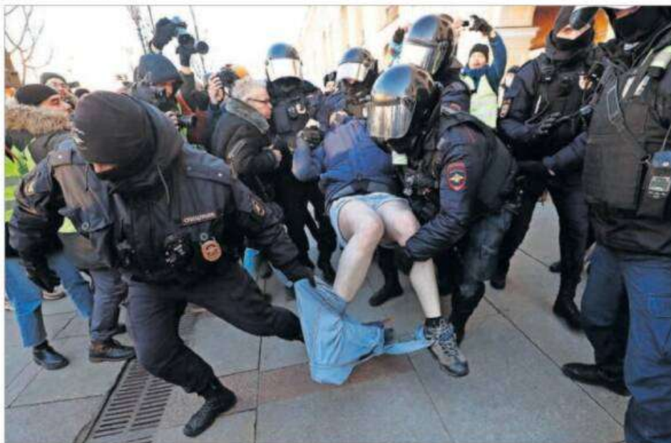
La policía detiene a un manifestante en San Petersburgo durante una concentración contra la invasión rusa de Ucrania.