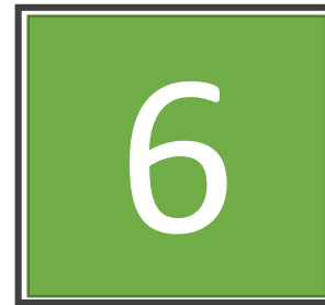
CLASES DE GS