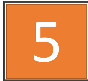
CLASES DE MS