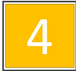
CLASES DE PS

La escuela maternal del Liceo tiene actualmente 15 clases de nivel y 1 clase multi-edad